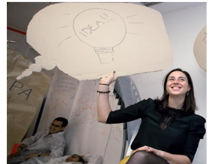
Entrepreneurship @ IE